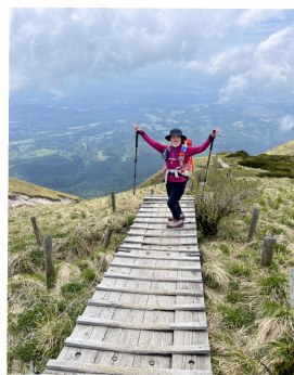
大山頂上付近気持ちのいい板道

6合目から元谷経由で下山。ガスってなければ北壁が間近に迫って見える。ゆっくりした山歩きで無事下山。満足した大山登山であった。